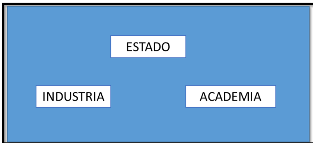
Ilustración 1. Modelo de universidad, empresa y relaciones gubernamentales